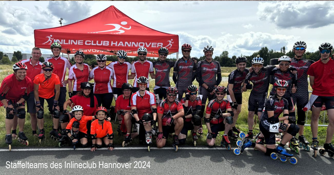
Staffelteams des Inlineclub Hannover 2024