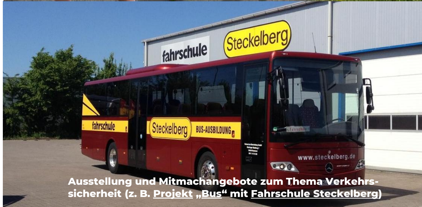
Ausstellung und Mitmachangebote zum Thema Verkehrssicherheit (z. B. Projekt „Bus“ mit Fahrschule Steckelberg )