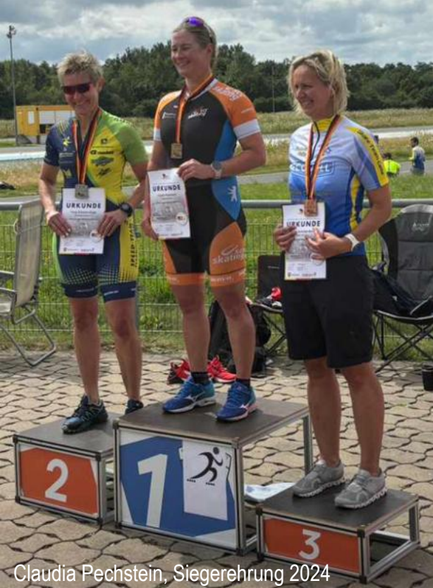
Claudia Pechstein, Siegerehrung 2024